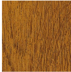
Golden Oak genarbt