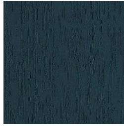
Anthrazitgrau genarbt (ähnlich RAL 7016)