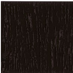
Braun Dekor genarbt