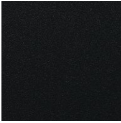
Schwarz Ulti-Matt (ähnlich RAL 9011)