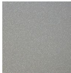
Weißaluminium RAL 9006